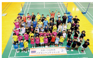
タイ・ナショナルチームの合宿