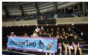
ヨネックス・秋田マスターズ2018 応援の様子