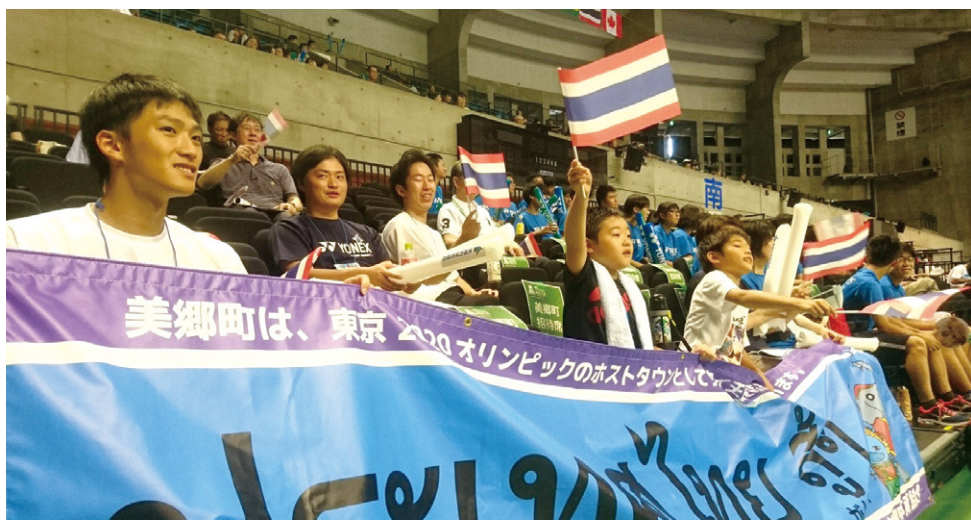
ヨネックス・秋田マスターズ2019 応援の様子