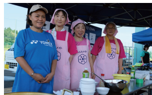
トムヤムクンを提供