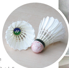
バドミントン競技で 実際に使用されたシャトル