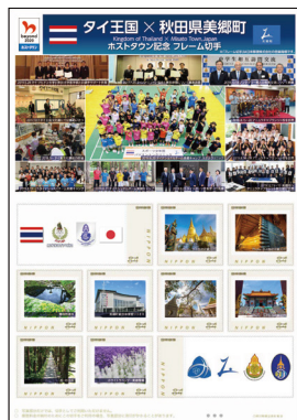
ホスタタウン記念フレーム切手

12月12~27日 | 東京2020オリンピック ホスタタウンPR展開催(公民館)