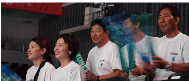
ダイハツ・ヨネックスジャパンオープン 応援の様子