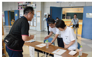
タイ・ナショナルチームの合宿での活動