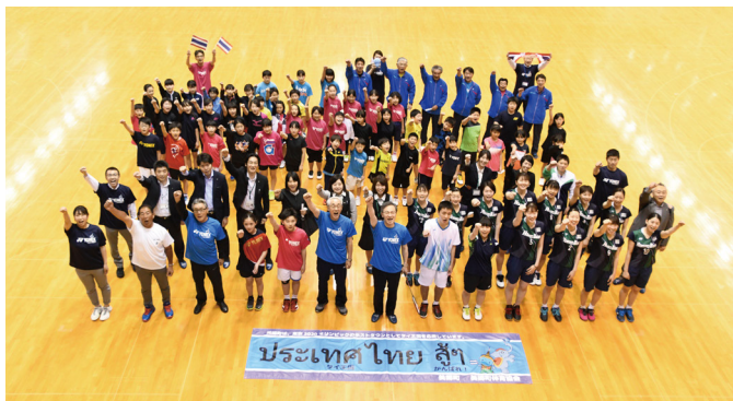
応援ビデオメッセージ