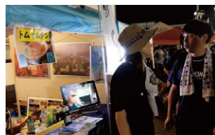
「美郷ちゃん夜市」特設ブースにて

9月8日 | “ラベンダーカップ”会場で 町のホストタウン活動を紹介した 他、トムヤムクンを提供