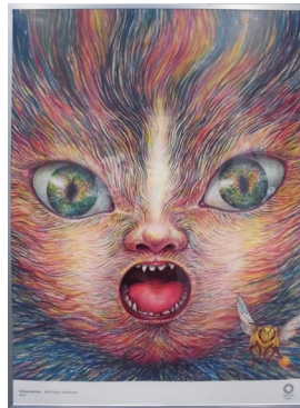
東京2020公式アートポスターを展示