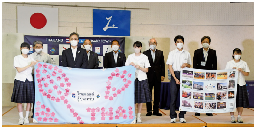
タイバドミントンナショナルチームへの応援横断幕