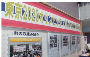
ホスタタウンの取組み紹介パネル