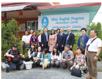
チャーター便で行く「タイ王国文化交流」