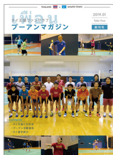
プーンマガジン創刊号

7月25~26日 | ダイハツ・ヨネックスジャパンオープンで応援 会場:東京都調布市「武蔵野の森総合スポーツプラザ」