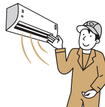
給湯器やエアコンといった設備を省エネ用の高性能なものに交換

省エネ設備の交換や建物自体の冷暖房効果を高めることで、必要なエネルギー消費を抑えることが可能です。断熱性能が高く、暖かい『省エネ住宅』は、住まい手の健康づくりにもつながります。