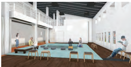
■1階:多目的スペース(大)のイメージ図

美郷町の「水」をイメージした水色の畳が開放 的に広がるやさしい空間に。愛称は「みずたまり」。