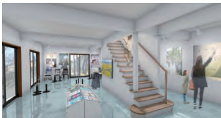
■清水の学習・案内所 水の休み場のイメージ図

「観光案内休憩所 清水の館」を「清水の学習・案内所 水の休 み場」としてリニューアルしました。名水市場湧太郎内の旧水 文館の学習機能を移転し、清水について、やさしく、詳しく学 習できるよう整備しました。