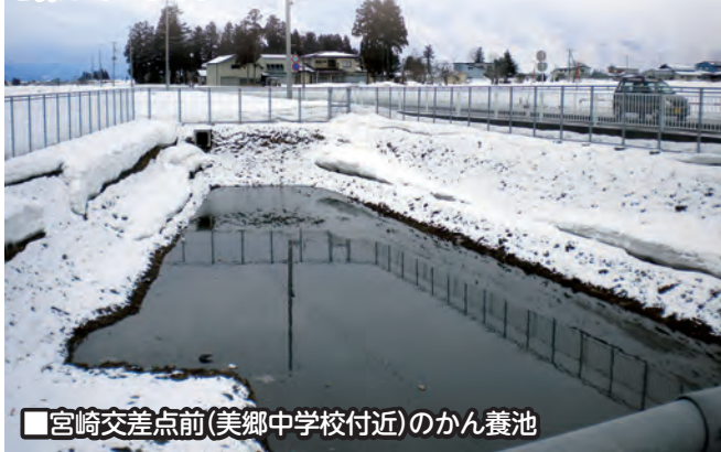
■宮崎交差点前(美郷中学校付近)のかん養池

秋から冬までの間の地下水の水位低下を防ぐために、人工かん養池を整備しています。美郷町には5つのかん養池があり、渇水期にはかん養池に注水をして地下水位を保っています。