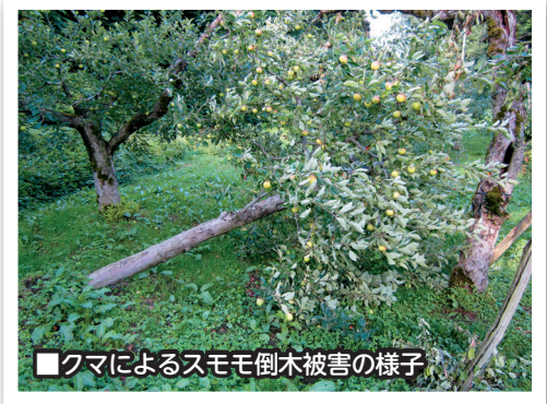
■グマによるスモモ倒木被害の様子