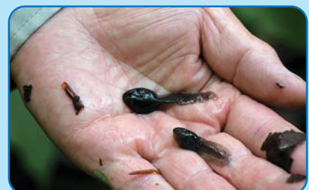
■池に生息するオタマジャクシ

モリアオガエルの天然記念物指定のきっかけは、昭和45年から5年計画で行われた秋田・岩手両県を結ぶ峰越林道の開削工事でした。モリアオガエルは環境の変化を受けやすい生物で、林道開通による自然環境の変化や登山者の立ち入りにより絶滅していくおそれもあったことから、保存を要望する声が高まりました。