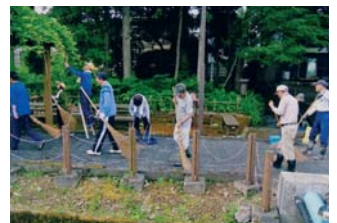
■清水清掃活動の様子