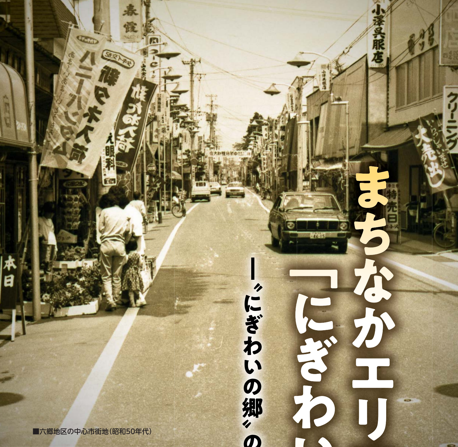
■六郷地区の中心市街地(昭和50年代)