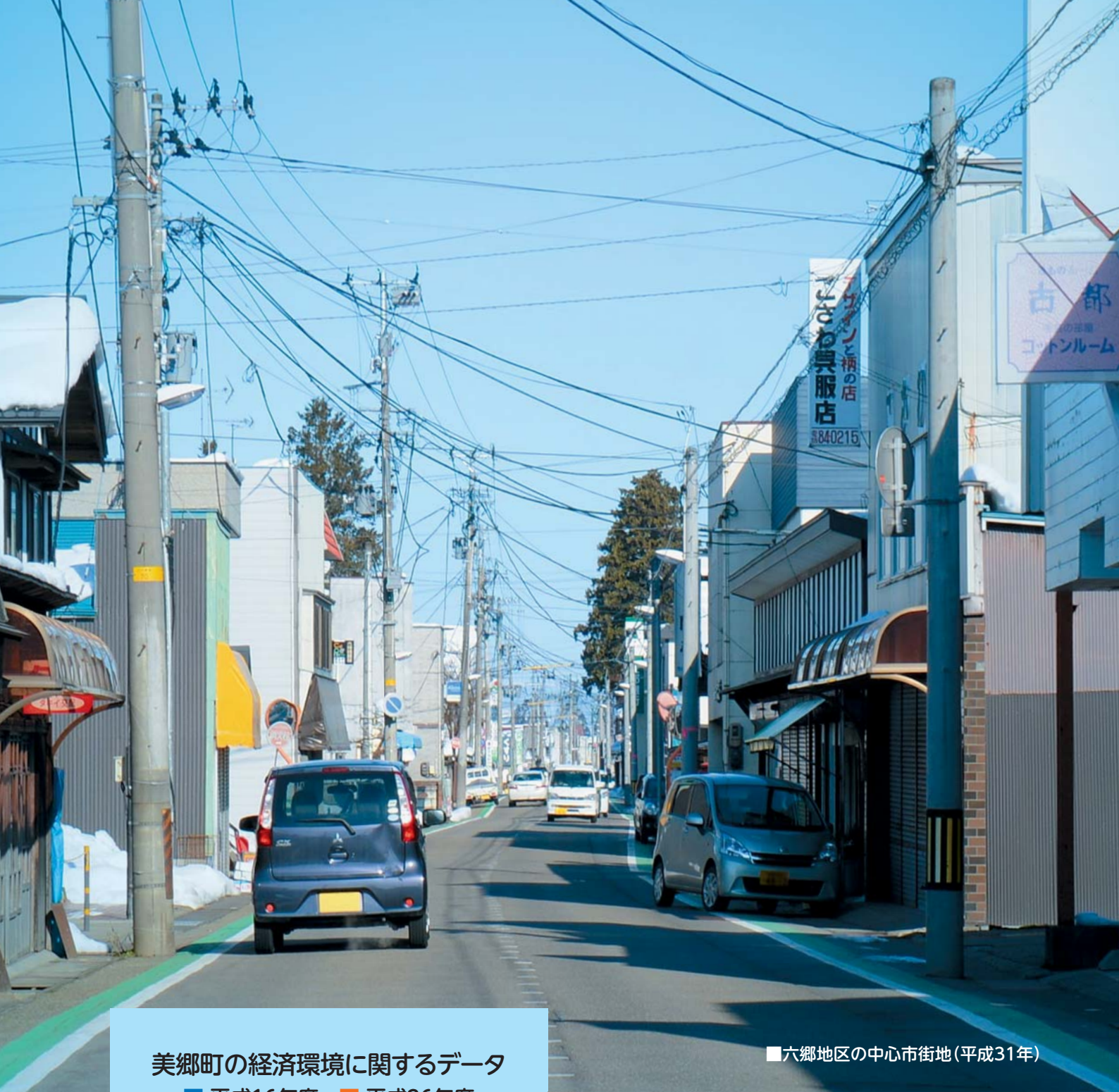
■六郷地区の中心市街地(平成31年)