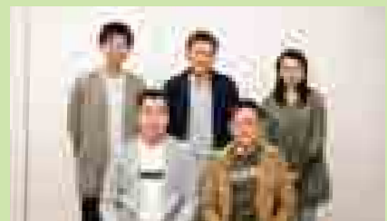
■実行委員の皆さん

「誰かに悩みを聞いてほしい」「いろいろな話を聞いてみたい」。同じような考えをもっている方はいませんか?ケアカフェみとは、皆さんのそういった悩みや考えを共有できる場所です。皆様のご参加をお待ちしています!