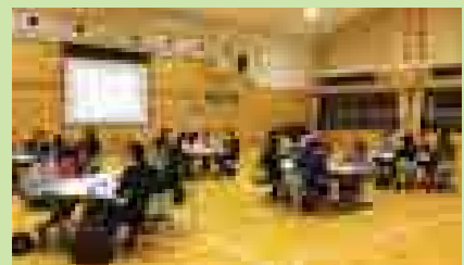
■ケアカフェみさとの様子

HP https://carecafemisato.wixsite.com/carecafemisato