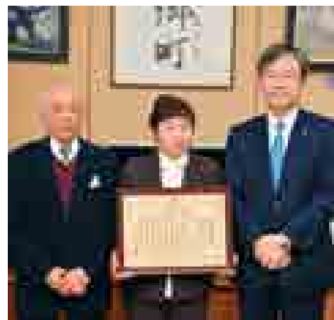
■秋田県肺がんネットワーク「あけびの会」