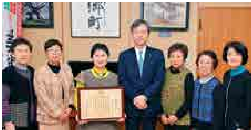
■せせらぎコーラス