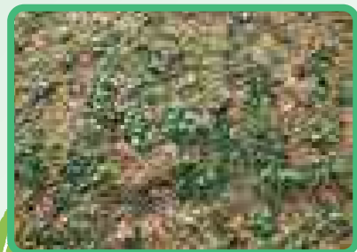
1年目のセンブリ(美郷町前山試験圃場)