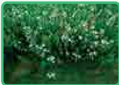
2年目のセンブリ(長野県栽培農家)