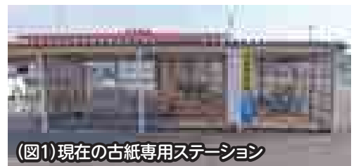
(図1)現在の古紙専用ステーション