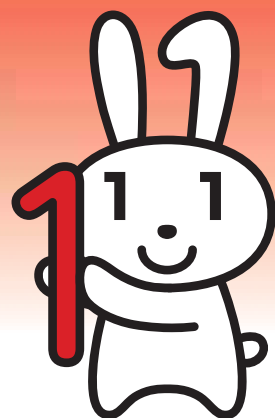
マイナンバー キャラクター マイナちゃん