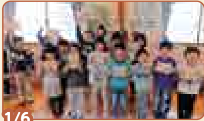
1/6 「はがきケースをつくろう!!」