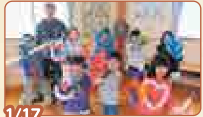
1/17 「バルーンアートに挑戦しよう!!」