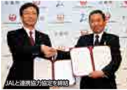
JALと連携協力協定を締結