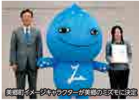
美郷町イメージキャラクターが美郷のミズモに決定