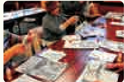
新聞エコバック作り体験 「デザインを活かす!マイエコバック」