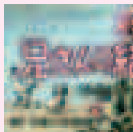
幻灯作品 1952年 「兄さんの結婚」より

1993年より千葉県史料研究財団にて県史編纂事業に関わり、98年より女性労働協会に勤務。2011年4月より厚生労働省委託「女性就業支援全国展開事業」の講師として活躍中。