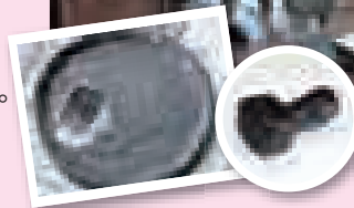
昨年は「陶ハンコ」、「皿」を作りました

住民活動センター「みさぽーと」では、町民の皆さんの市民活動やボランティア活動のお手伝いをしています。