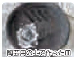
陶芸用の土で作った皿