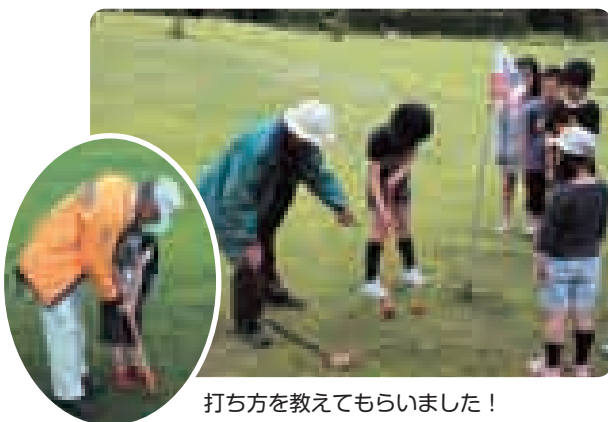
打ち方を教えてもらいました！

ホールインワンが決まると、児童や“みさぽーと”と一緒に喜び合う姿が見られるなど、グラウンド・ゴルフ場には歓声が響いていました。