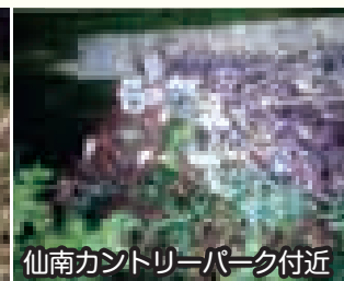
仙南カントリーパーク付近