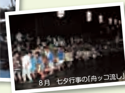
8月 七夕行事の「舟ッコ流し」

8月に行われる七夕行事の「舟ッコ流し」は六郷地区町内の子ども会が主体となり、町内からお伊勢堂川へと舟ッコを引く子どもたちが練り歩きます。このような、古くから受け継がれている伝統行事を今後も継承していくことが、町全体の重要課題となっています。