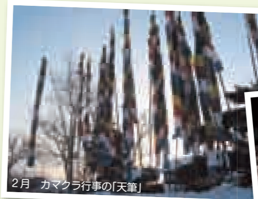
2月 カマクラ行事の「天筆」

国の重要無形民俗文化財に指定されている「六郷のカマクラ」は2月11日から始まり、2月15日の「天筆焼き」や「竹打ち」で締めくくられます。毎年、豊作や安全を祈願して行われ、鎌倉時代から続く伝統の小正月行事です。また、小正月行事の「どんど焼き」も地域に伝わる貴重な伝統行事として残されています。