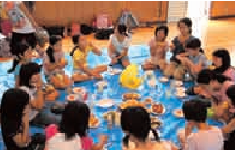
▲千屋小学校で野菜収穫パーティーを行う両校児童の皆さん

最終日には各ホームステイ先から持ち寄った野菜で「収穫パーティー」が開かれ、トマトやきゅうり、ジャガイモなどを塩や味噌で味付けして食べました。3日間の交流を終えた御田小の子どもたちは「秋田のお父さん、お母さんができてとてもうれしかったです。今度は東京で待っています」と話し、美郷町を後にしました。 8月7日から9日には、千屋小学校児童24人の皆さんが御田小学校を訪問しました。各ホームステイ先の方々と活動した後には徳川家の菩提寺の一つである増上寺に宿泊し、午前5時30分からは朝のお勤めを体験しました。普段と違う環境に神妙な顔つきの子どもたちは足の痺れをこらえながら約30分間のお勤めを終えました。このほか、子どもたちは御田小学校の屋上プールで水泳をしたり、美郷町産の野菜を使ったカレーを皆で食べるなどして交流を深めてきました。 34年目を迎える交流の歴史 千屋小学校と御田小学校の交流は今年で34年目を迎えます。今回、この長い歴史を物語る出来事がありました。御田小学校の引率で美郷町を訪れた宮本さんは27年前の小学5年