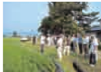
▲昨年の産地訪問ツアーの様子

9月15日、16日の二日間は関東圏の美郷米取扱店に生産ほ場を視察していただく産地訪問ツアーを開催し、安全で安心な美郷米をPRします。