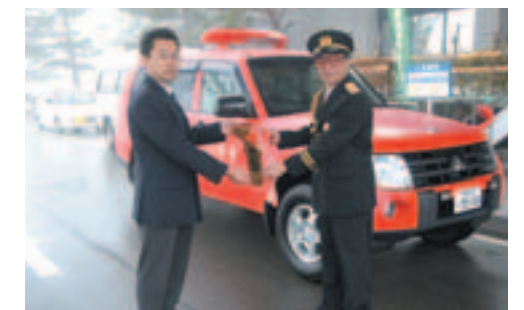
▲田澤町消防団長へ模造キーが手渡されました。

■(財)日本消防協会 (財)日本消防協会より町消防団へ、赤色灯搭載の消防指令車1台が寄贈されました。