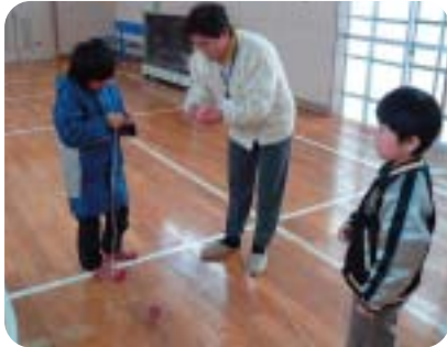
「昔あそび」 みさぼーたーとコマまわしに挑戦☆