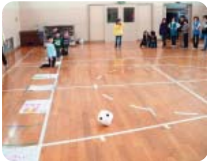
「大すごろく大会」 青汁飲んだよ！