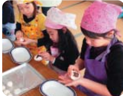
「おやき作り」 みんなでこねこね！おいしくできたよ！