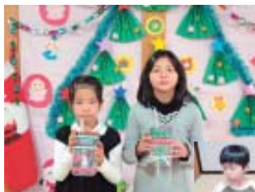
「キャンドルスタンド工作」

ペットボトルを使ってクリスマスキャンドルスタンドを作ったよ★中に水が入るとキレイだよ。