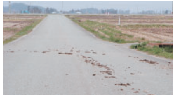
落とした泥は通行の妨げになります。

5月は、耕起・代掻き・田植え作業等で農耕車が道路を通行する機会が多くなります。道路に土塊、泥等を落とした場合は、必ず除去及び清掃を徹底し、通行者の迷惑にならないようお願いします。