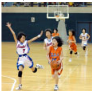
▲女子リーグ決勝試合