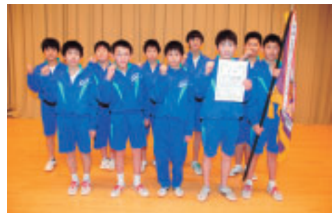
▲優勝を果たした仙南中学校卓球部の皆さん