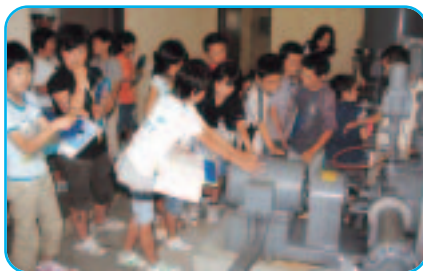
消毒のみの方式の天神堂浄水場(仙南中央地区)で説明を受ける金沢小学校の児童(7月12日)