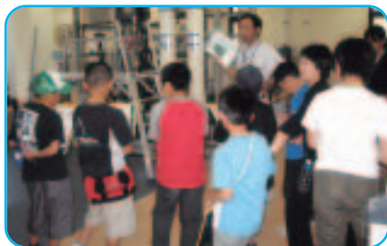
膜ろ過方式の六郷東部浄水場で説明を受ける六郷東根小学校の児童(7月6日)