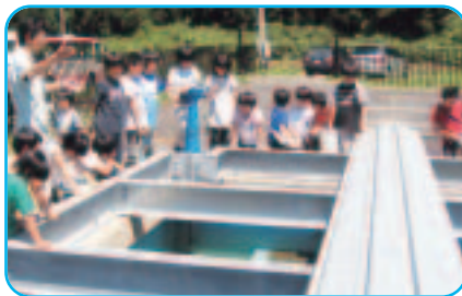
緩速ろ過方式の千畑東部浄水場で説明を受ける千屋小学校の児童(7月9日)