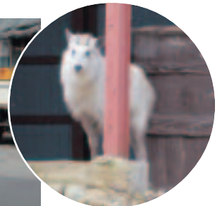
▲物かげに隠れ周囲の様子を伺うカモシカ