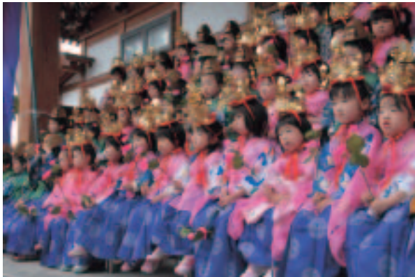
▲台蓮寺で記念撮影をする子どもたち