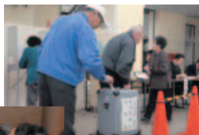
町内21カ所の投票所で投票が行われた

任期満了に伴う秋田県議会議員一般選挙(大仙市仙北郡選挙区・定数5人)が、3月30日に告示され、4月8日に投票が行われました。 投票は、町内21カ所の投票所で午前7時から午後7時まで行われ、午後8時から町仙南公民館で即日開票されました。 美郷町の開票結果は次のとおりです。