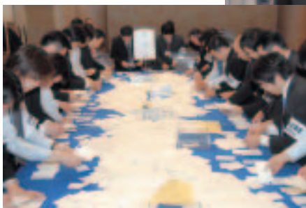
仙南公民館で行われた開票作業