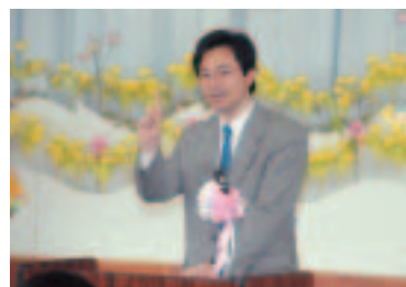
4月7日に行われた、すこやか園(仙南幼稚園・保育園)の入園式で祝辞を述べる松田町長。