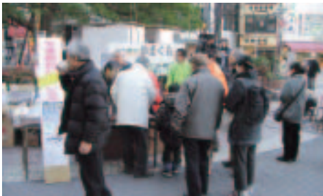
▲緑の濃い木々と商業ビルに囲まれた「鳥追い小屋」は新鮮な光景。

会場には本町出身者で組織する、ふるさと会の皆さんも駆けつけていただいたほか、開催にあたり地元商店街など多くの大田区民の皆さんにご協力いただきイベントを盛り上げました。