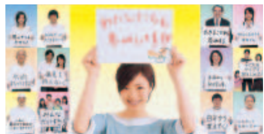
第56回 “社会を明るくする運動”

地域でのふれあいを深める、家族の対話を多くするなど、誰もができることから始められる幅広い運動を呼びかけ、安全で安心して暮らせる地域づくりをめざします。