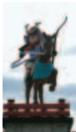
◀イメージキャラクター「雁太郎(がんとらう)」の像