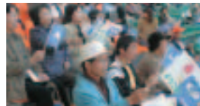
▲手作りの看板で選手を歓迎