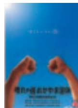
◀第60回国民体育大会「晴れの国おかやま国体」公式ポスター

「秋田わか杉国体」「秋田わか杉大会」の公式ポスター等のデザインを募集しています。募集要項については、秋田わか杉国体のホームページ( http://www.pref.akita.jp/kokutai/poster/index.htm )をご覧ください。または国体準備室までお問い合わせください。