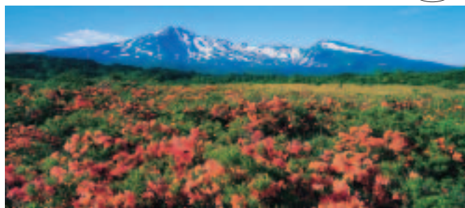
▲「レンゲツツジと鳥海山」

写真展「水輪廻」は、素晴らしい作品を通して自然の大切さを再認識してほしいと企画しました。