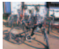
貸し出し用自転車 (町内 5 カ所に設置)

問い合わせ 役場(六郷庁舎)町長公室 行政推進班 ☎84-4900(内線1224)