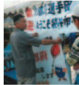
▲選手の応援に一喜一憂