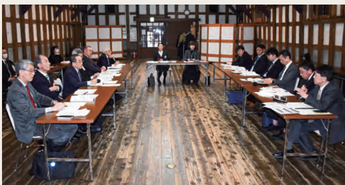
議員6名、商工会8名で意見交換