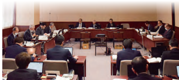
予算特別委員会で審査