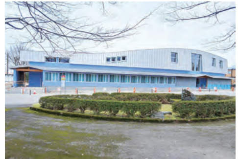
共用開始予定の子ども子育て支援拠点施設

一次避難所での対応が困難になるような大規模災害で、年代別の避難が必要になる際には、補助施設として活用していく。