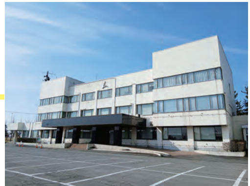
整備する旧南行政センター