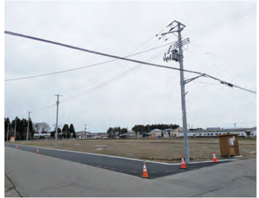
宅地分譲地の全景

良好な住環境と統一感のある街並を形成するため、建築協定制度を導入し、建物の用途や形態などに一定のルールを設けます。