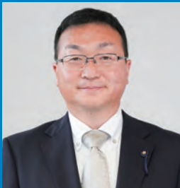
たか はし じゅん 高橋 純 議員