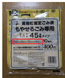
もえるごみ袋（45L）の規格表示箇所

利用者の所作で穴や破れが生じた場合は、 テープなどで塞げばそのまま使用できるので、町広報や町ホームページで周知する。