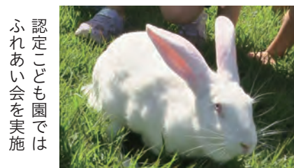
認定こども園ではふれあい会を実施

町長 美郷町畜産振興組合で生産者を募ったが、状況は変わらず。まずは畑屋うさぎを知ってもらうことが肝要と考え、美郷フェスタでのふれあいコーナー設置など、様々なことに取り組んできた。今後も興味・関心の掘り起こしを図りつつ、意欲のある方には飼育技術の習得機会などを設け、継承を支援していく。