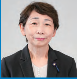
はせがわ ゆきこ 長谷川幸子 議員