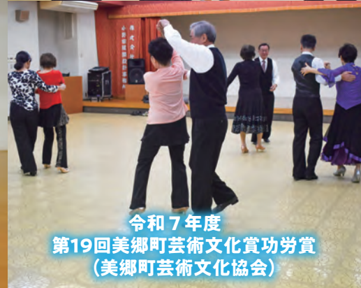
令和7年度 第19回美郷町芸術文化賞功労賞 (美郷町芸術文化協会)