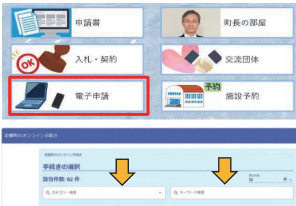
▼町ホームページとパソコンのイメージ