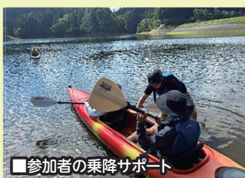
■参加者の乗降サポート

このイベントは、農業用水の溜池のため稲刈りが終わる秋限定でしたが、おかげさまで大盛況のうちに、無事終了することができました。美郷町では、このほかにも季節ごとに様々なイベントが行われていますので、ぜひお気軽にご参加ください。また、サン・アールへお越しの際は、お声がけいただければ幸いです。年末年始は寒さが厳しくなりますので、皆様、体調には十分お気をつけください。来年もどうぞよろしくお願い申し上げます。