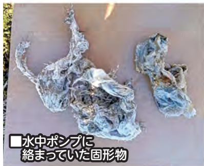
■水中ポンプに絡まっていた固形物

下水道施設で点検を行ったところ、各家庭から流入した異物がポンプに付着していました。点検のたびに同様の現象が起こっていて、このような状況が続くとポンプの寿命が短くなり、交換が必要になります。下水道施設は、処理区の皆さんの施設です。今一度、右記の注意事項をご確認いただき、下水道の使用ルールを守るようお願いいたします。