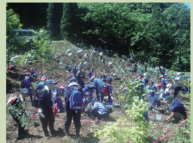
2019年に行われた植樹の様子▶

'22七滝「水の森」植樹事業には、町内の小学校4年生の児童と関係者の皆さんなどが参加する予定です。植樹前には、各小学校の授業として、森林のはたらきについての学習を行います。