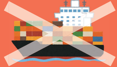
新型コロナウイルス感染症の影響で輸出できません