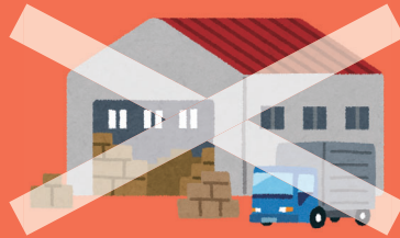
回収しても保管場所が確保できません

その古着と古布について、新型コロナウイルス感染症の影響により再資源化としての流通が滞っていること、また、資源物としての受け入れ先の確保が困難な状況が続いていることから、令和3年度は回収を一時休止としますので、皆さまのご理解とご協力をお願いします。