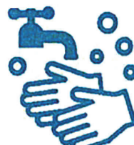
石けんによる手洗い