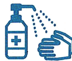
手指消毒用アルコールによる消毒の励行

ワクチン接種は強制ではありません。ワクチン接種による感染症予防の効果と副反応のリスクの双方について、正しい知識を持っていただいたうえで、自らの意思で同意し、接種を受けていただきます。