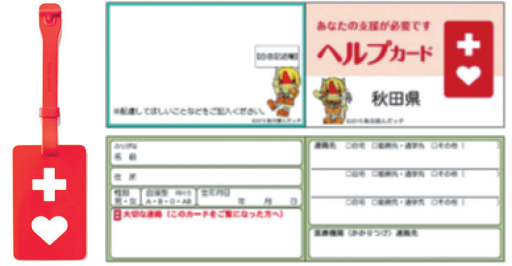
▲ヘルプマーク ▲ヘルプカード 配布場所 ● 町福祉保健課