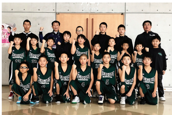
■千畑バスケットボールスポーツ少年団の皆さん