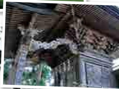
▲本殿(東南側) ◀日吉神社本殿