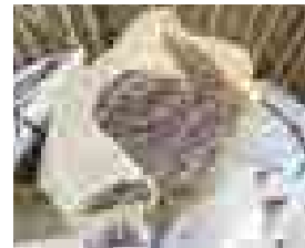
①町指定ごみ袋以外に入られた木の枝

また、それぞれの行政区において決められたごみ集積所があるにも関わらず、他の行政区のごみ集積所にごみを出す人が確認されています。ごみ集積所は、各行政区