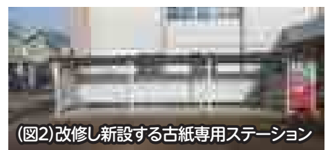
（図2）改修新設する古紙専用ステーション