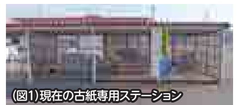
（図1）現在の古紙専用ステーション

美郷町南行政センター前の古紙専用ステーション（図1）が除雪センター建設に伴い解体されます。そこで、美郷町南体育館前の自転車置き場を改修し、古紙専用ステーションを新設します（図2）。利用開始などについては次のとおりですので、ご理解とご協力をお願いします。