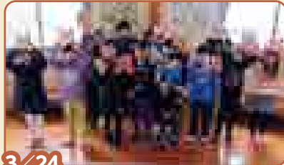
3/24 【木製ティッシュスタンドをつくろう!】