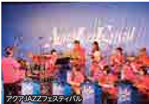
アクアJAZZフェスティバル