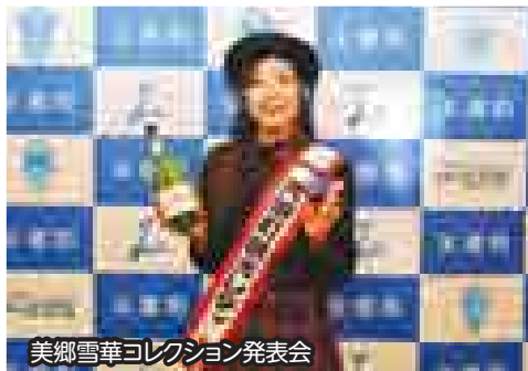
美郷雪華コレクション発表会