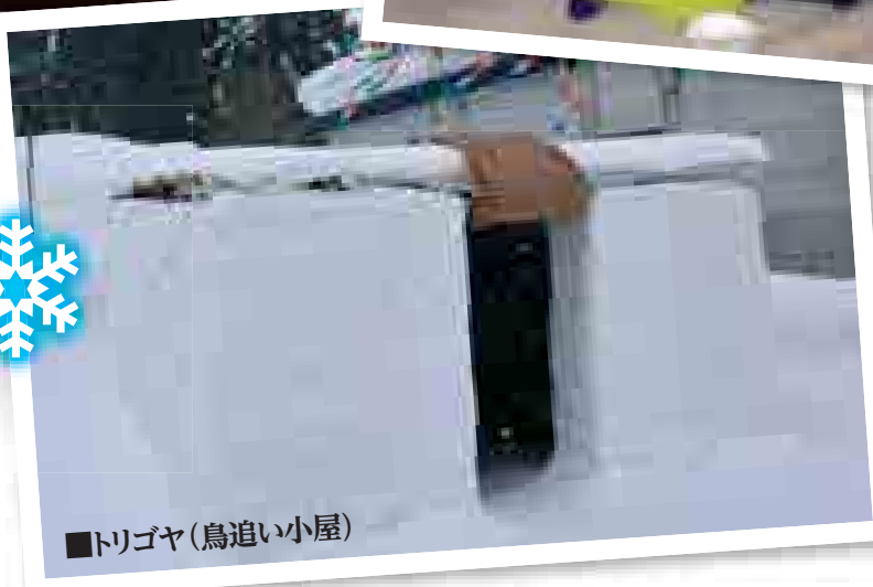
■トリゴヤ(鳥追い小屋)