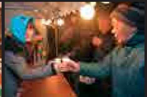
▲竹うち会場での甘酒サービス。