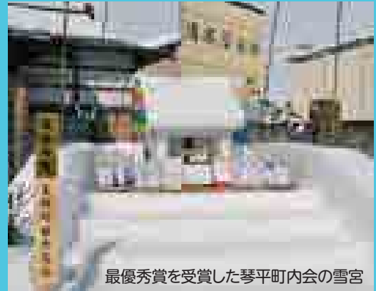
最優秀賞を受賞した琴平町内会の雪宮

各町内会で作られた雪宮・鳥追い小屋が、訪れた観光客や地域住民の目を楽しませました。町観光協会主催で行われたコンクールでは、昨年に引き続き琴平町内会が最優秀賞を受賞しました。