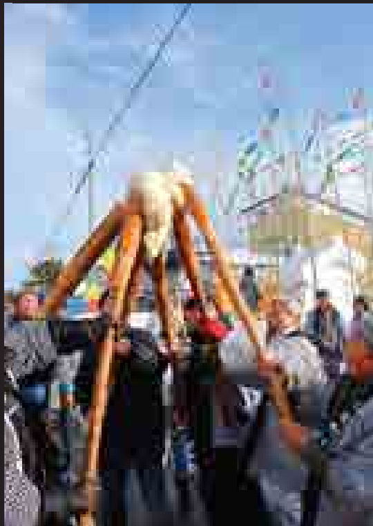
▲各町内会では、男衆によって威勢よく餅つきが行われました。

国 の重要無形文化財に指定されている『六郷のカマクラ』が2月11日から15日にわたって開催されました。11日の天筆書きから15日の竹うちまでさまざまな行事が行われ、町内外から観光客が集まり町中が活気で満ち溢れました。