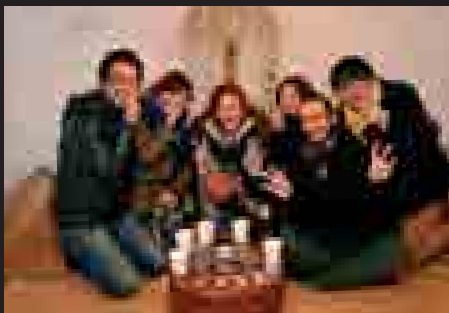
▲鳥追い小屋を体験する観光客の皆さん。