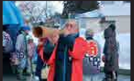
▲「ボヘー」という木貝の音が町内に響き渡り、祭りのムードを盛り上げました。