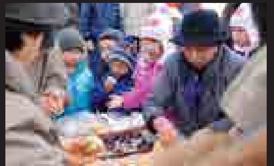
▲つきたてのお餅には、あんこやきなこが施され、子どもたちや観光客に振る舞われました。