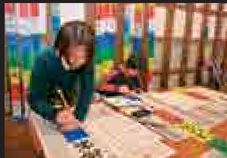
▲湧太郎で行われた天筆書き体験。