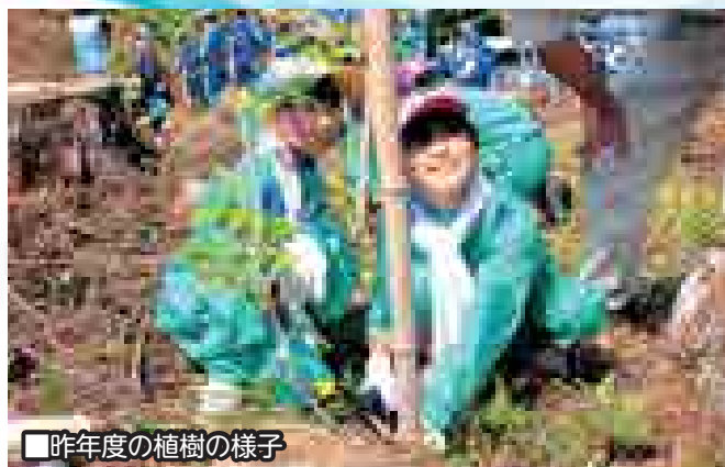
■昨年度の植樹の様子