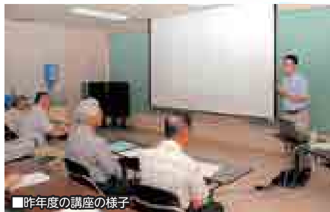
■昨年度の講座の様子

日時●6月14日(土) 午後1時30分～午後4時30分 場所●美郷町中央ふれあい館(旧清水苑)第1会議室 申込方法●6月11日(木)まで電話でお申し込みください。 ※第2回以降の日程については町広報紙等でお知らせします